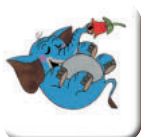
LEHNI SI NA ZÁDA