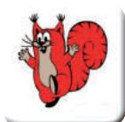
SKÁKEJ PO JEDNÉ NOZE