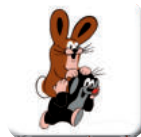
LEZTE SI NA ZÁDA