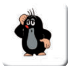
PODRBEJ SE NA HLAVĚ