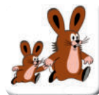
CHYŤTE SE ZA RUCE